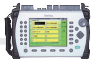
MT9082A アクセスマスター

光ファイバーの敷設や保守現場で必要となる測定機能(光パルス試験、光損失試験、可視光源およびIP試験など)を1台で提供することが可能なフィールド用計測器です。