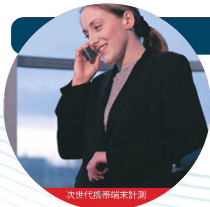
次世代携帯端末計測