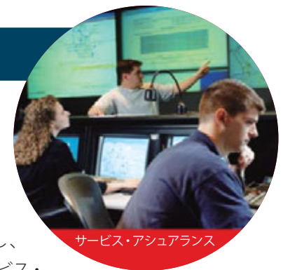
サービス・アシュアランス

当社は、大手通信事業者を中心に、先進ネットワークモニタリングシステムなどを提供しています。今後は、欧州だけでなく、世界の各地域で強化した通信事業者専門営業チームの活動により売上を拡大し、収益の改善に努めます。