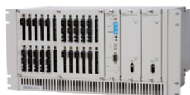
アナログ回線IP多重化装置 NN6001A