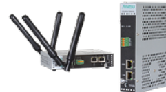
Adaptive Gateway NN4000シリーズ