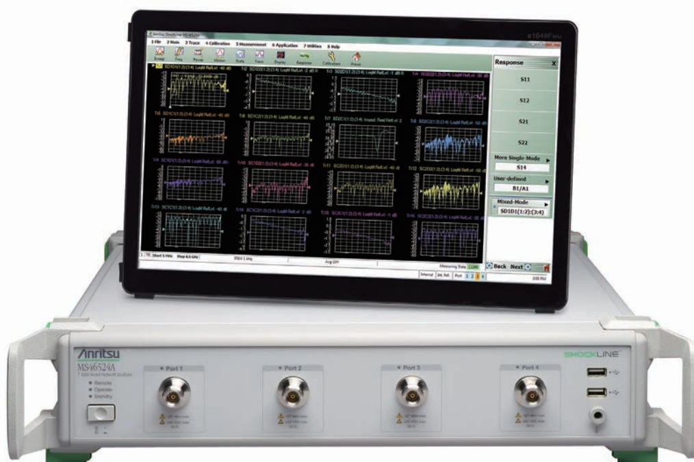
MS46524A 4ポートShockLine™ VNA