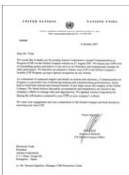
GCから受領した Notable COPレター

当社は、グループ横断的なCSR活動を推進しながら、株主・投資家の皆様に企業活動をご理解いただくため、積極的に情報開示や対話などのコミュニケーション活動を行っています。