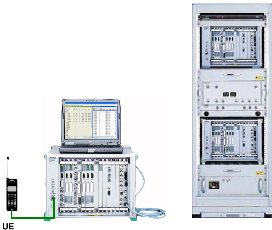
* 写真はイメージです。実際の外観と異なる場合があります。

ME7832AプロトコルコンFORMANCEテストシステムは、3G/3.5G携帯電話システムのプロトコル規格適合試験規格である3GPP TS34.123章とTS51.010章で定義された試験項目が容易かつ迅速に実行できるプロトコル規格適合試験システムです。