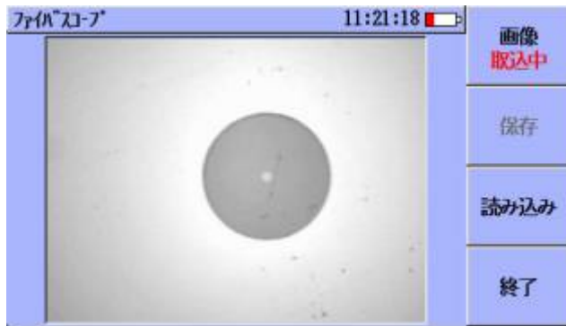
汚れのない光ファイバのフェルルール端面例

400 倍ファイバ스코ープ(VIP Lite: Visual Inspection Probe Lite)は、光ファイバのコネクタ端面のキズや汚れを、モニターを通して確認する外部接続タイプのスコープです。光コネクタ端面のキズや汚れは、コネクタ接続部の反射や損失の要因となります。この反射や損失が大きいと通信への影響も十分考えられるため、コネクタ端面のクリーニング作業は極めて重要です。特にコネクタ端面にキズが付いている場合は、反射や損失の原因の特定が困難です。ファイバ스코ープを使って端面状況を確認できれば、コネクタ交換の判断材料にもなります。ファイバ스코ープを使った光ファイバのコネクタ端面チェックは、光ネットワークの建設、保守作業をサポートします。