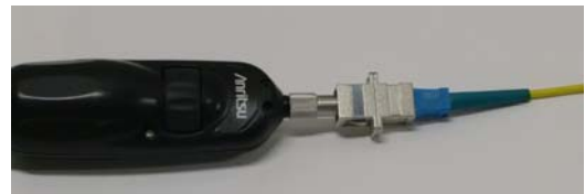
アダプタ, パッチパネル対応チップ接続イメージ