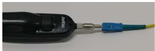
ユニバーサルファイバ対応チップ接続イメージ