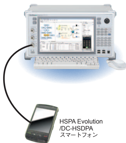
HSPA Evolution /DC-HSDPA スマートフォン

MX847510A-011 HSPA Evolution/DC-HSDPA オプションは、Rel.7、Rel.8の packets 通信試験に対応します。HSPA Evolution/DC-HSDPA に対応したスマートフォンなどの携帯端末の性能試験、ストレス試験の環境を容易に構築できます。また、専用のGUI「SmartStudio」を使用することにより、基地局パラメータの設定や、スループット試験中のパケットレートの変更ができるため、シナリオ作成の時間を削減し、試験時間を大幅に削減できます。また、MX847510A-001 HSPA オプションを組み合わせることにより、Rel.99からRel.8までの packets 通信試験を1台でカバーすることができます。