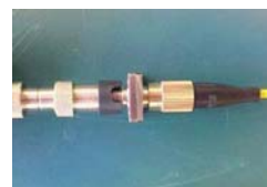
コネクタアダプタチップ接続イメージ (写真は FS-PT-FC)