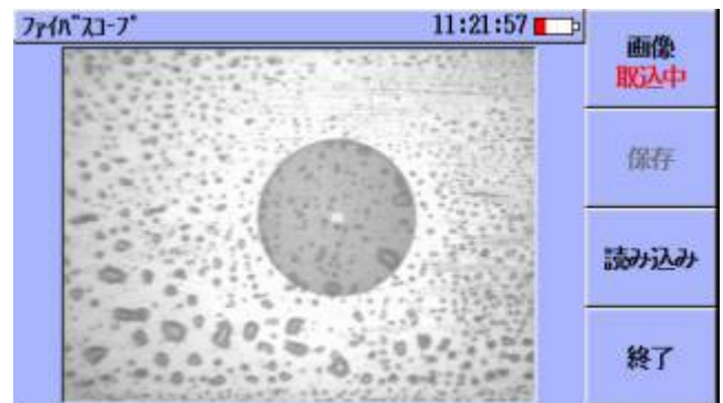
汚れの付着した光ファイバのフェルル端面例