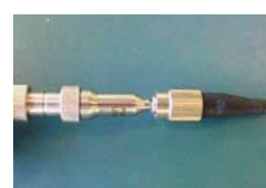
ユニバーサルチップ接続イメージ (写真は FS-PT-U25)