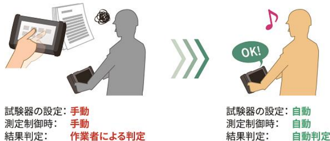
MT1000A シナリオ自動による試験作業