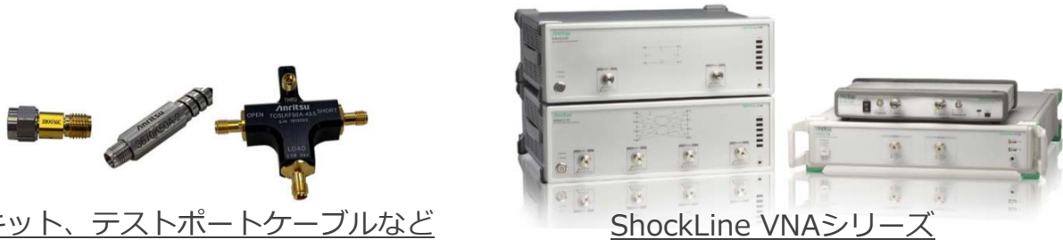
CALキット、テストポートケーブルなど